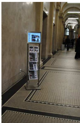
Freistehendes System 15" mit Ablagen

Um die einzelnen Displays effizient zu bewirtschaften, die Gäste optimal zu führen oder/und Dienstleistungen attraktiv anzubieten stehen Ihnen verschiedene Software Tools zur Verfügung. Neben der manuellen Bedienung der Anlage besteht auch die Möglichkeit, alle oder Teile der Informationen über ein Interface herzustellen und zu verteilen.