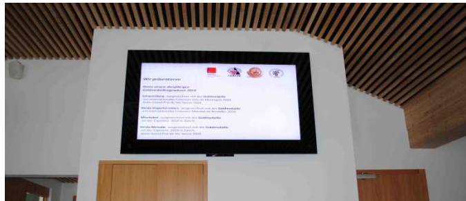
70» Display Flachmontage

Bei den verwendeten Komponenten handelt es sich ausschliesslich um Teile die für den professionellen Einsatz konzipiert sind. Dies bezieht sich sowohl auf die Elektronik, wie auch auf die verwendeten Materialien für das Gehäuse. Es werden Grössen von 10,4" bis 80" angeboten. Diese können sowohl in Landscape- wie auch in Portrait-Format installiert werden.